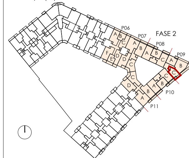
Planta Tipo (x4)