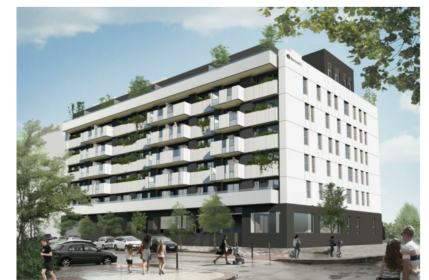
VISTA DESDE LA CALLE RAMÓN RUBIAL ESQUINA CALLE CIPRIANO DÍAZ EL HERRERO