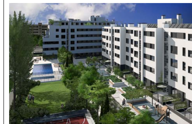
VISTA DEL INTERIOR DE LA URBANIZACIÓN