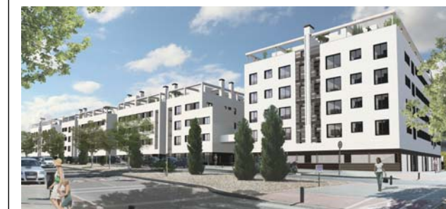
VISTA DESDE LA CALLE JORGE OTEIZA ESQUINA PASEO DE LA DEMOCRACIA